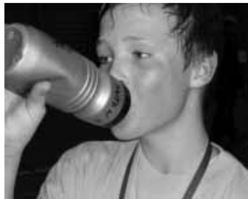
Ljungskogens bästa café ligger i sporthallen. På söndagar under perioden oktober t o m mars är du välkommen att titta in i hallen. Förutom ett fantastiskt café får du uppleva fart, kamp och vilja på nära håll.

vill veta mer, välkommen att kontakta undertecknad på tel 070-845 17 28