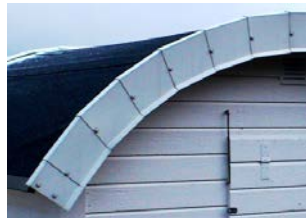
Så här får det inte vara