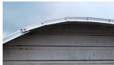
eller så här

Som förklaring till besiktnings- anmärkningsanmärkningar: