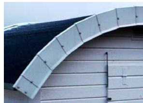
Så här får det inte vara