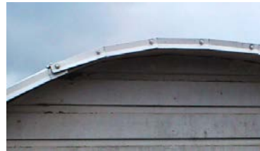
eller så här

Som förklaring till besiktnings- anmärkningsanmärkningar: