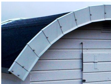
Så här får det inte vara