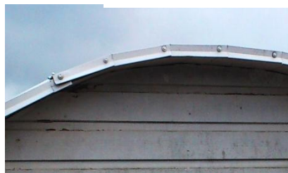
eller så här

Som förklaring till besiktnings- anmärkningsanmärkningar: