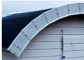
Så här får det inte vara