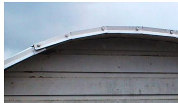
eller så här