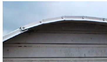
eller så här