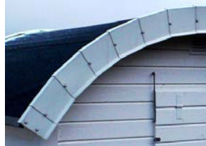
Så här får det inte vara