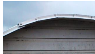
eller så här

Som förklaring till besiktnings- anmärkningsanmärkningar: Detta är Vindskiva Detta är Vattbräda