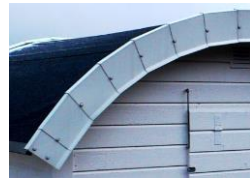
Så här får det inte vara

§ Vindskivor och vattbräda (taklist) skall vara av trä och ej av plåt, plast eller gummi.