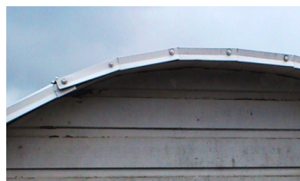
inte heller så här

Som förklaring till besiktningens-anmärkningsanmärkningar: