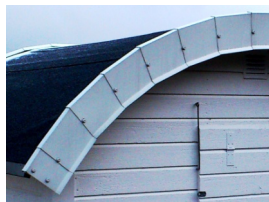
Så här får det inte vara

§ Om siffror saknas eller ej följer gällande standard, kontakta bhv.badhytterna@gmail.com § Vindskivor och vattbräda (taklist) skall vara vita av trä eller plåt, ej plast eller gummi.