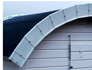
eller så här

Vid frågor kontakta bhv.badhytterna@gmail.com