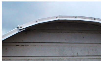
Så här får det inte