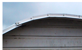
eller så här